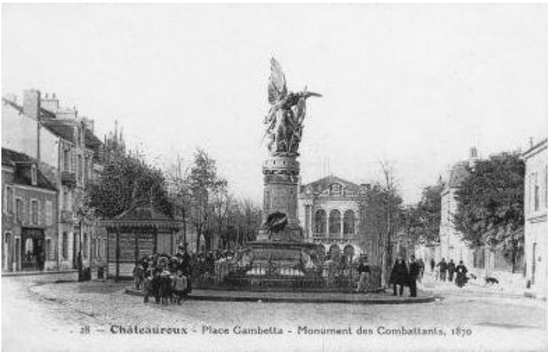
Place Gambetta, Monument des Combattants en 1870.

Au fond, le théâtre municipal construit en 1832. Il anime la vie culturelle castelroussine tout au long du XIX e siècle.